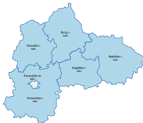
1 lentelė. Pažangos priemonės įgyvendinimo teritorija ir veiklos.

Priemonės veiklos bus įgyvendinamos FZ Strategijoje numatytoje teritorijoje: Biržų rajono, Kupiškio rajono, Panevėžio miesto, Panevėžio, Pasvalio ir Rokiškio rajonų savivaldybėse.