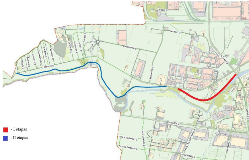
2 pav. Projektų veiklų įgyvendinimo teritorijos.

Priemone planuojamomis investicijomis nebus dvigubų tų pačių veiklų finansavimo. 2014–2020 m. programavimo periodo lėšomis įgyvendinto projekto „Pėsčiųjų ir dviračių tako nuo Vakarinės g. link Berčiūnų gyvenvietės modernizavimas (I etapas)“ veiklos aiškiai atsiskiria nuo projektu „Pėsčiųjų ir dviračių tako nuo Vakarinės g. link Berčiūnų gyvenvietės modernizavimas integruojant į bendrą bevariklio transporto tinklą“ planuojamų vykdyti veiklų.